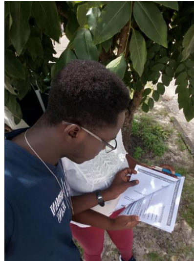
Wyboo, Grand-Santi / Saint-Laurent du Maroni